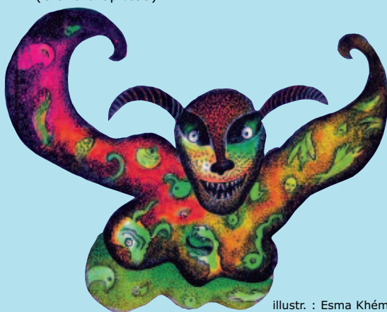
illustr. : Esma Khémir

Nacer Khémir signera ses livres à l'espace librairie. (Grand chapiteau).